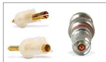
Entrada com guia para o pino central