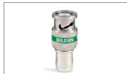
1695ABHD1 Conector BNC HD com Plenum tamanho 2 RG6