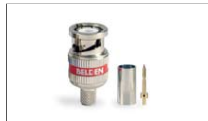
1505ABHD3 Conector BNC HD RG59