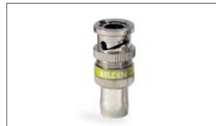
179DTBHD1 179 Conector BNC com trava Digital Truck